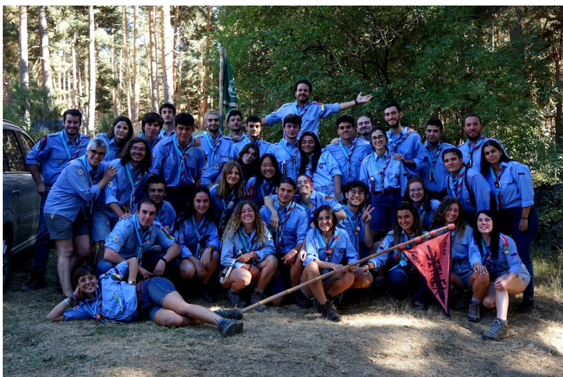
Clan Rover Ítaca

Finalmente, entre risas, familia y lluvias, se clausuró el campamento y aquí estamos de nuevo, con más ganas que nunca para dar paso a esta nueva ronda 2022-2023.